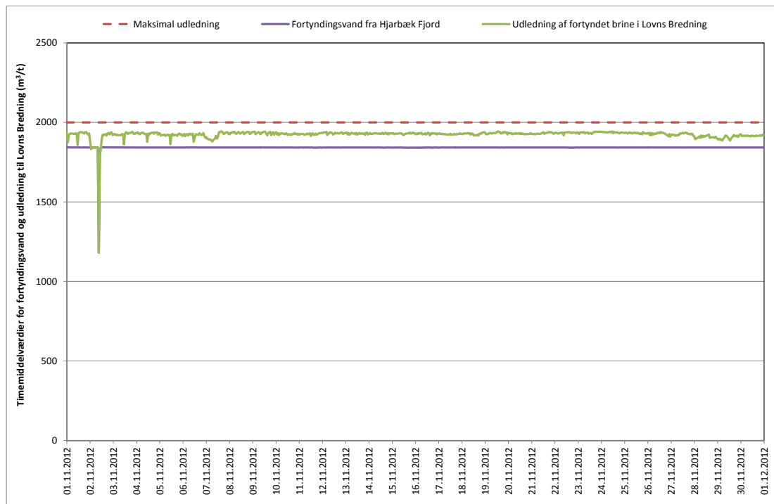
Figur 3 Flow af fortyndingsvand fra Hjarbæk Fjord og flow af udledt fortyndet brine til Lovns Bredning